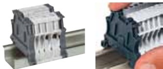
Tope final 0 375 10 montaje sin tornillos